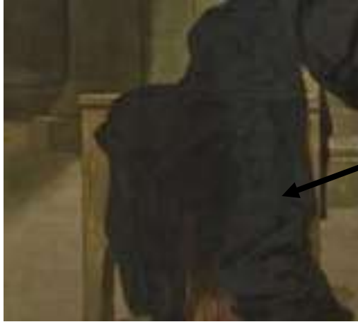
Vêtement monastique, robe de bure.

Couronne et toge au sol, symbolisant la fin d'une dynastie. Ces symboles seront remplacés par l'habit monastique posé sur la chaise juste au-dessus.